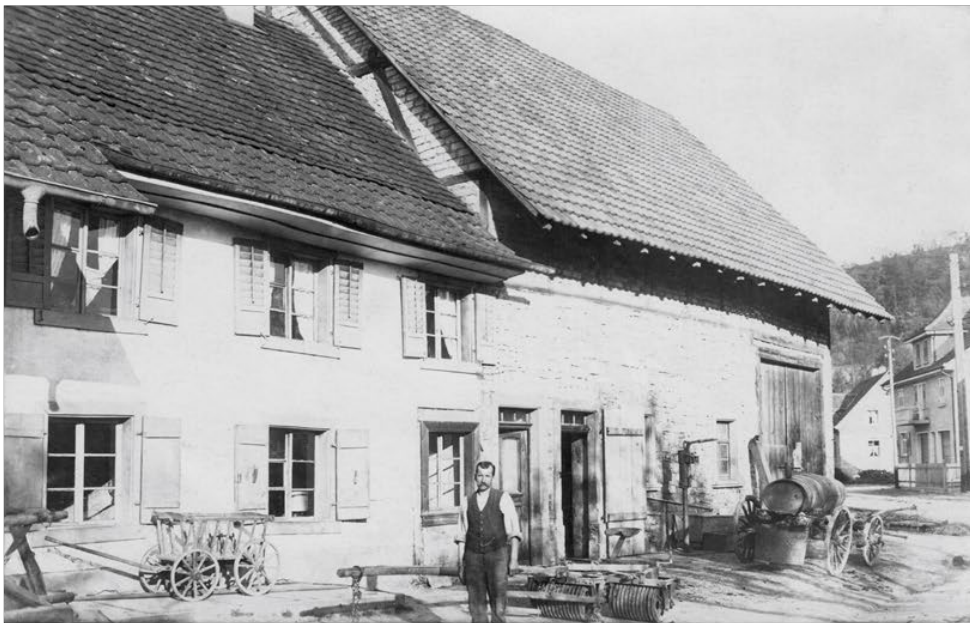
«Haus Hauptstraße 8 mit Johann Brunner»

Thema des nächsten Treffens ist „Einstige und verbliebene alte Häuser. Das Wutöschinger Ortsbild im Wandel der Zeit“